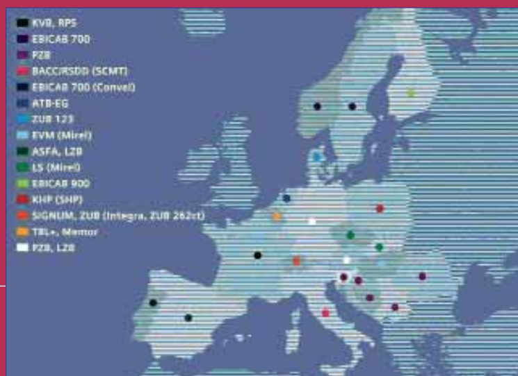
Fig. 3 - Sistemi di protezione della circolazione dei treni utilizzati in Europa